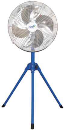
1 落地扇 AFG-18NL-i