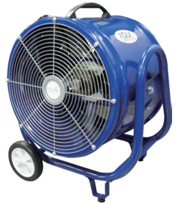
8 大型轴流式 AFR-18NL-i