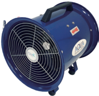
6 轴流式 AFR-08NL-i