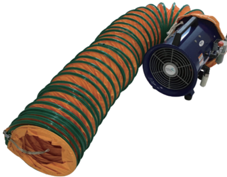
7 中型轴流式 AFR-12NL-i