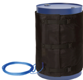
新 14 200L大油桶 CLJ-HHD-i