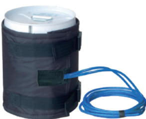
新 13 小圆桶 (18L&20L) CLJ-A-P-i