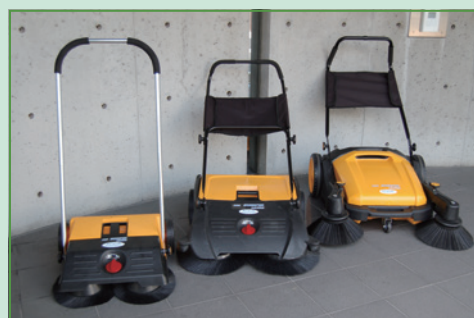
Model nhỏ gọn nhất trong dòng AJL.