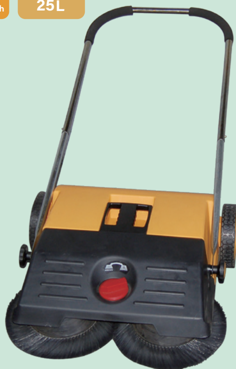
Khi bạn di chuyển về phía trước bằng tay, các chổi bên sẽ quay kết hợp với nhau. ▲