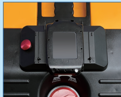
Hoạt động bằng pin và có thể chạy trong khoảng 2,5 giờ