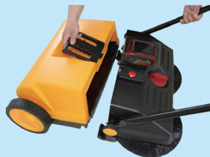
Đễ dàng loại bỏ và xử lý rác