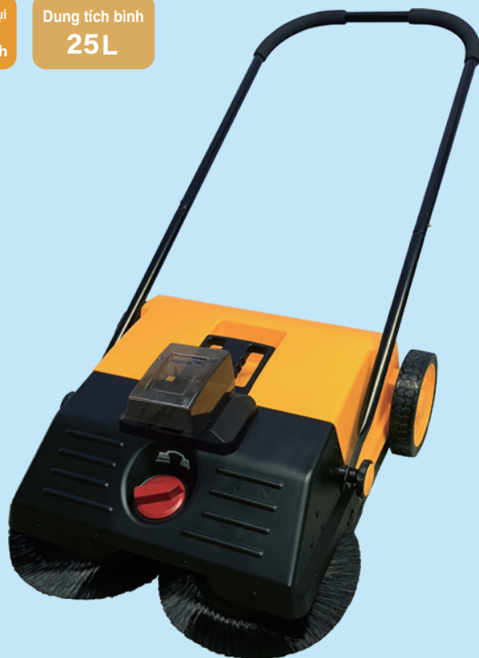
Bàn chải 2 bên tự động xoay ▲