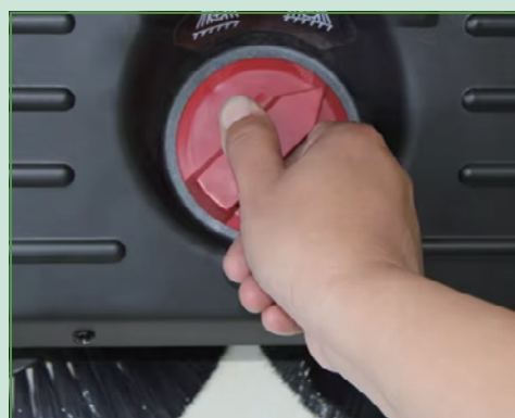
Bạn có thể điều chỉnh vị trí bằng cách xoay núm.