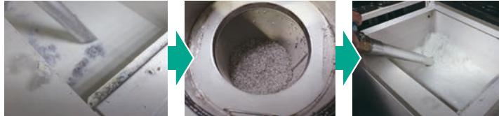
Thu thập dầu cắt gọt

Thu thập chất lỏng cắt từ máy cắt gọt và lọc tạp chất lạ chỉ có chất lỏng sạch được giữ lại cho máy để tái sử dụng.