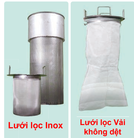
Lưới lọc Inox