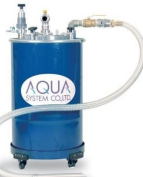
APDQO-FS100 i / FF 100 i