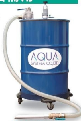
APDQO-FS i / FF i